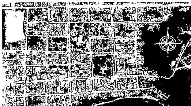
Imagen 6. Localización de la vía a intervenir